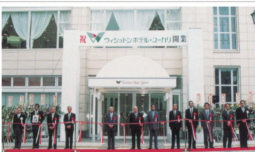
1998年ウィシュトンホテル・ユーカリオープン

こうしてユーカリが丘は、単なる住宅地ではなく、「暮らしやすい都市」としての骨格を着実に築きながら、人と街がともに成長する街づくりを進めてきたのです。