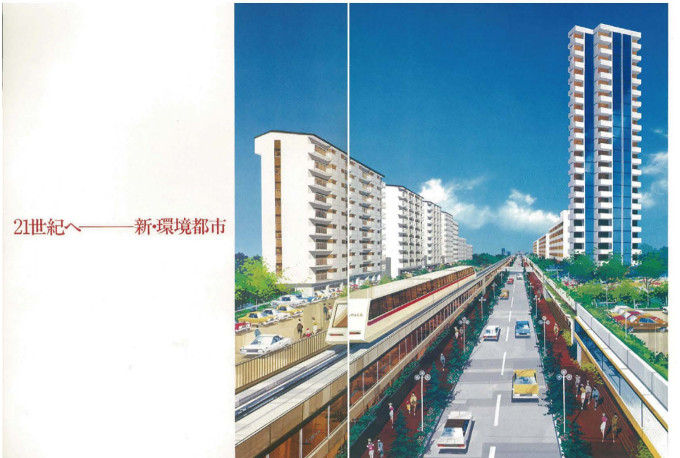
21世紀へ——新・環境都市