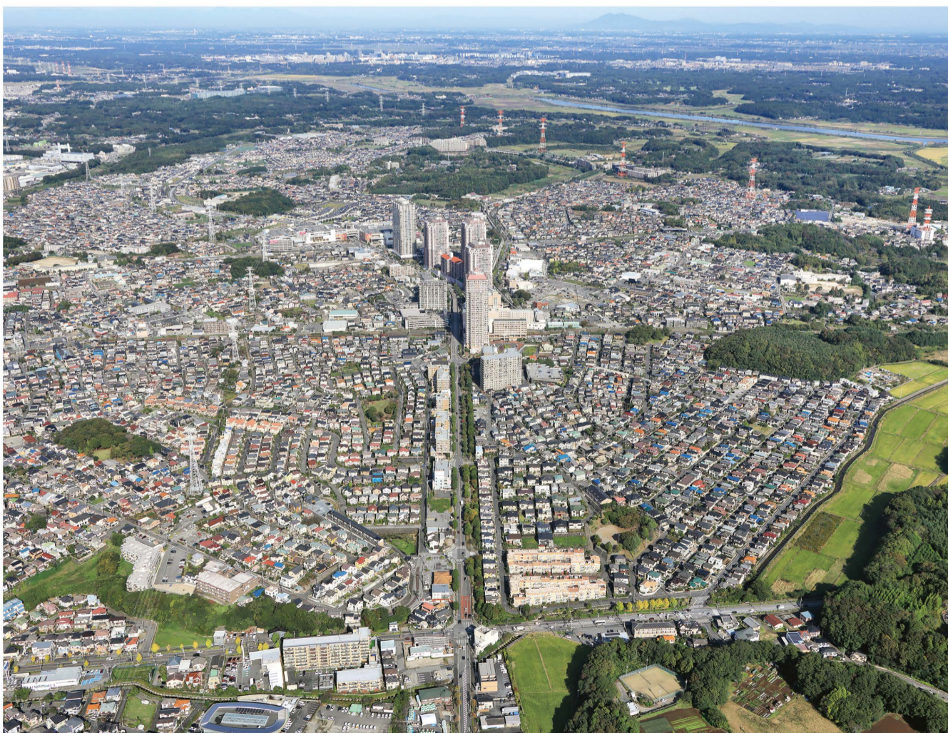
2024年ユーカリが丘南側上空から望む街並み