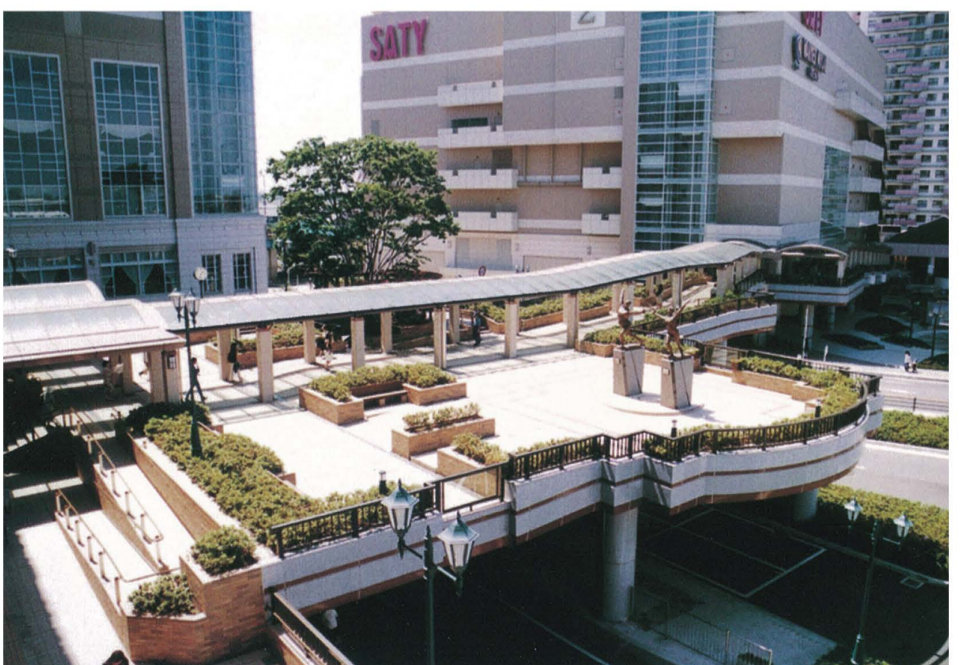
1999年(平成11年)ペDESTリアンデッキ全面供用開始