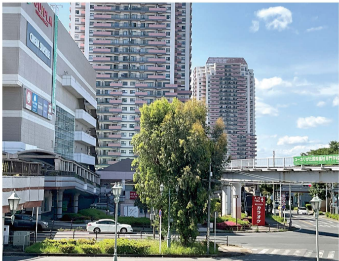
ユーカリが丘駅北口ロータリーで大きく育ったユーカリの木

「ユーカリが丘」という街の名称には、開発当初からの強い想いが込められています。日本の高度経済成長期以降、公害問題が社会課題となる中、山万は自然と都市機能が調和する新しい環境都市を目指しました。空気の浄化や殺菌作用を持ち、大きく育つユーカリの木に未来の街の姿を重ね、豊かな自然の中で人と街がともに成長していく願いを込めて、この名が付けられました。また、日本で初めてカタカナ・ひらがな・漢字の三つが入った地名として、あらゆる世代が暮らし、多様な施設が調和する街の姿と、日本語ならではの魅力と共に日本文化を世界へ発信したいという想いも込められています。