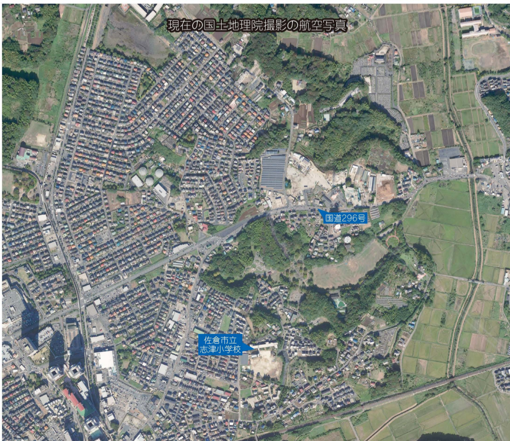
現在のユーカリが丘1丁目~4丁目・6丁目(一部)周辺を撮影したものです