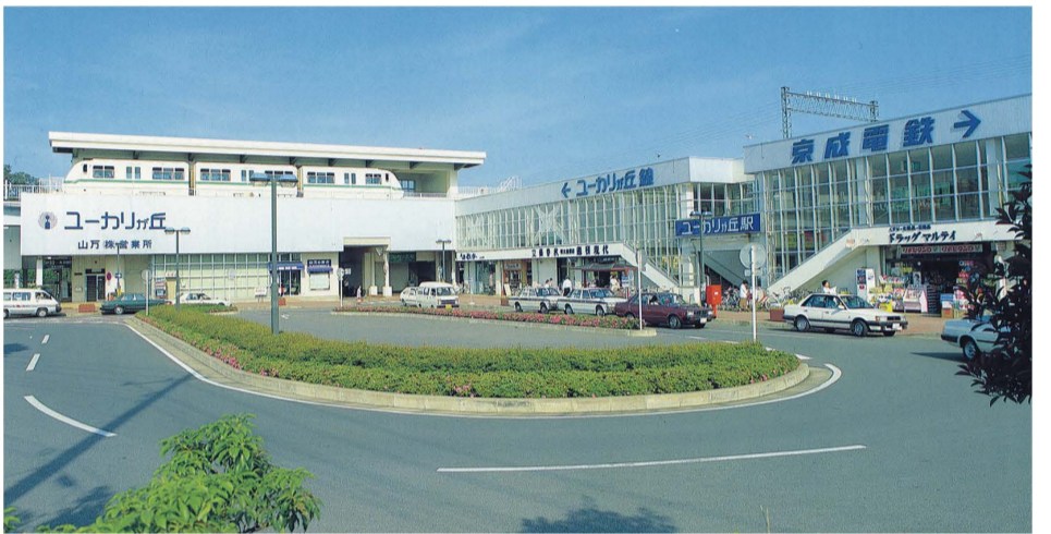
1982年(昭和57年)ユーカリが丘駅北口ロータリー