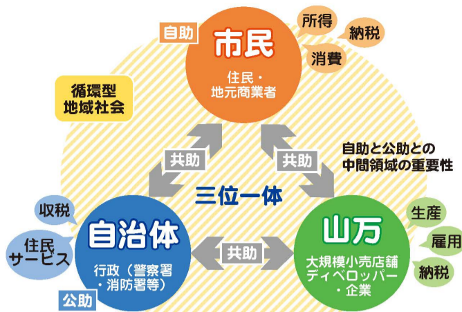
ユーカリが丘 三位一体の開発概念図

住民が街で暮らし、地域で消費し、行政が公共サービスを支え、山万が住宅や商業、交通、福祉などの都市機能を整備することで、街の中で人やサービスが循環する持続可能な地域社会を目指しています。