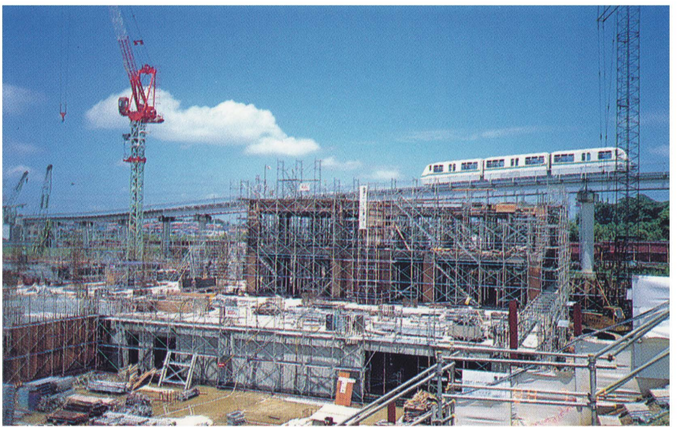
1988年(昭和63年)スカイプラザ建設中