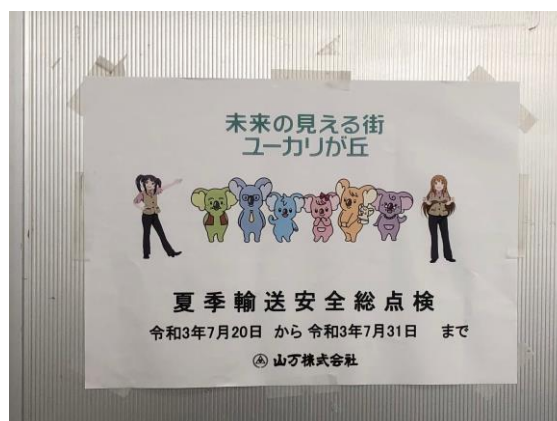
夏季輸送安全総点検の掲示（駅）