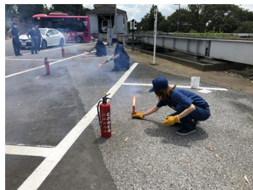
【発煙筒・点火訓練】