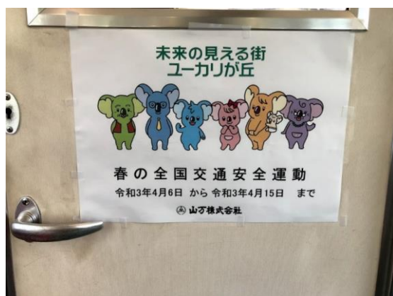
春の全国交通安全運動の掲示（車内）