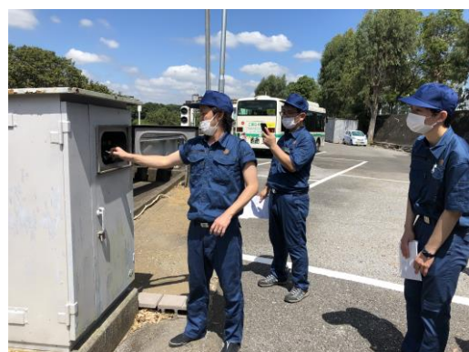
【転てつ器転換訓練】