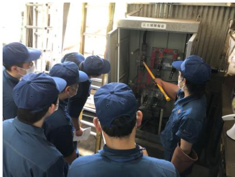
【車両基地内 区分開閉器 操作訓練】