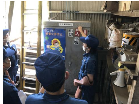
【車両基地内 区分開閉器 表示説明】