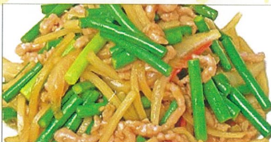
32. 和牛とニンニクの芽炒め