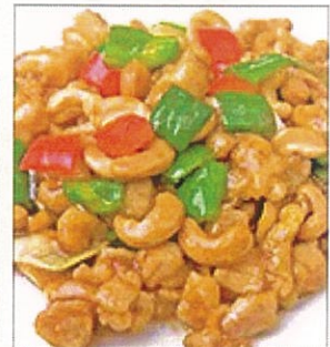
25. 鶏肉とカシューナッツ炒め