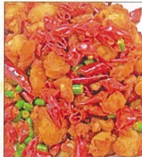
24. 鶏の唐揚げレ四川風味