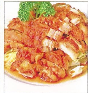
23. 鶏の唐揚げレ油淋鶏風味