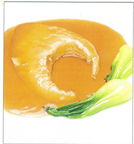
121. 気仙沼産フカヒレ姿煮