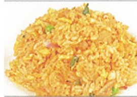
81. キムチチャーハン