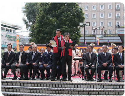
商店連合会と商店街振興組合が暴力団追放宣言