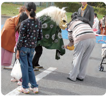
佐倉囃しの獅子舞