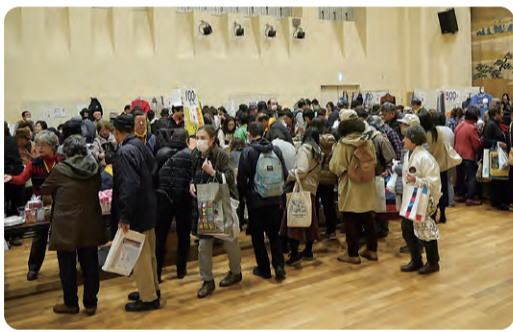
福祉バザーは今年も大盛況

恒例の餅つきや焼きそば、 豚汁、焼き芋や焼き鳥、ポッ プコーンに綿菓子、カフェや飲 み物販売など、多くの模擬 店も出て大変な賑わいとな りました。