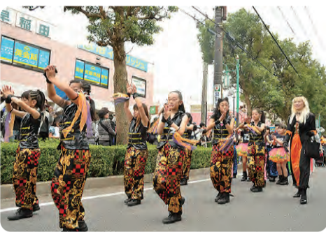
ハロウィンダンスパレード

ウィン仮装パレードもホコテ ン上で実施！普段車の往来 で入れない場所でのイベン トに、参加者もテンションが 上がって、パフォーマンスも 来年もぜひ参加したいとの 声が多数ありました。