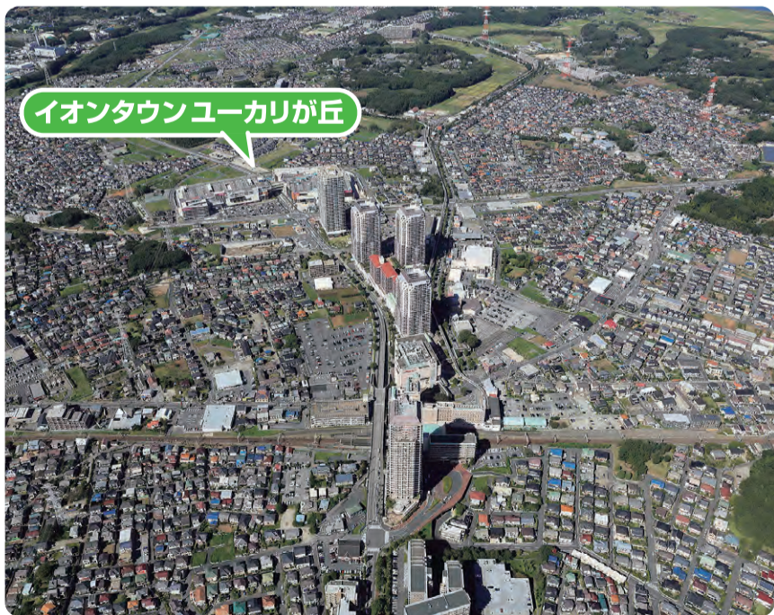
わがまち ユーカリが丘 (2016年10月撮影)

また昨年引き続きユーカリが丘駅北口への順天堂大学新キャンパス実現のために、努力して参ります。ユーカリが丘は開発着手から46年が経過し時代の