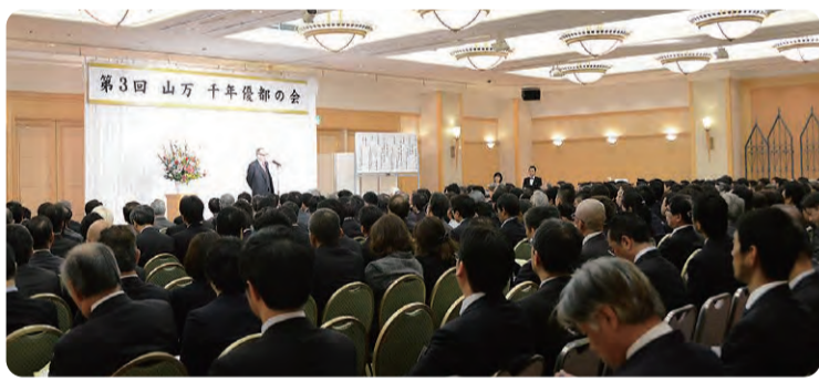
毎年年初に行なっている「山万千年優都の会」

さらには本年2月初旬よりスカイプラザ商業エリアのリニューアル工事に本格的に着手し年内オープンを目指してまいります。