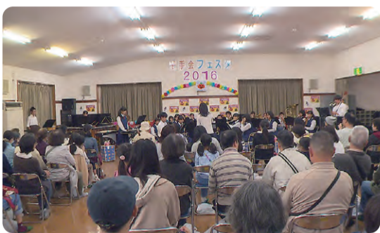
井野中学校吹奏部の演奏

生活を地域社会において営 むことができるよう支援す ること」を目的として設立 された法人だそうです。