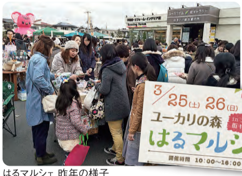
はるマルシェ 昨年の様子

◎開催日 3月25日(土)・26日(日) 10時~16時※荒天中止 ◎開催場所 山万街ギャラリー屋外 (ユーカーが丘3-14) ◎出店者募集(1月末まで)! ◎詳細・お問い合わせ 090 (5562)2017 ユーカーの森 はるマルシェ の件、とお問合せ下さい。