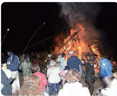
寒い夜に熱い炎が立ち上る

「どうしんぼく」といわれ る竹を中心にして、竹の先 端に葉を残した8本の竹で 周りを囲むように塚の上に 櫓を立て、竹囲いの中段ま で、青菅地区中から集めた 雑木や正月のお飾りや門松 などを積み上げて櫓を造り ました。