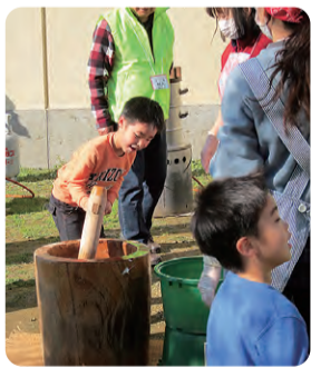
みんなで楽しくお餅つき

どの協力がありました。つき たての餅は体育館でふるま われ、食べ終わった後もしば らく各テーブルでおしゃべり に花が咲き会場内は笑顔の 輪が広がっていました。行事 担当の役員が中心となり特 に安全面を考慮し5ヶ月の 準備期間を経て、各班長総 出でスムーズに運営されて いました。