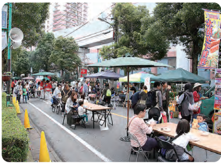
中央大通りにホコテン出現

「歩行者天国に大観衆！ ユーカーが丘商店連合会 主催の『第21回ユーカーフェ スタ2016』がハロウィン 直前の昨年10月29日(土) に、ユーカーが丘中央大通り を歩行者天国(以下ホコテ ン)にして、模擬店も出店。 大勢の人でにぎわいました。 前回は二部歩行者天国と し、駅前片側一方通行だけ でした。今回は住民の皆さ んのご協力です。銀行前 交差点からアクアユーカー 交差点までを一時通行止め の交通規制を行い、千葉銀 行前からサンサンビル前ま でホコテン会場として出店。 ホコテンでは様々なパフォー マーの大道芸や路上ステージ でのダンス、パフォーマンス など、新たな試みも実施。好評 を得ました。