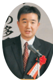
宮本 泰介 習志野市長