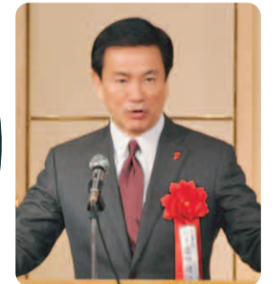
森田 健作 千葉県知事