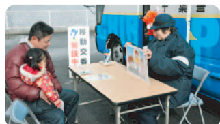
紙芝居で防犯意識を!

深くして、何かあった時にはどうするかなど、事前に話し合っておくことが重要だそうです。佐倉警察署の移動交番車がこの一月から一台増車されるそうです。本格稼働は四月からだそうですが、防犯や犯罪抑止に活躍が期待されます。移動交番車を見かけたら気軽に声をかけて頂くことをお勧めします。