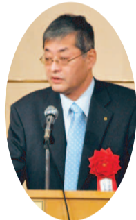
浦田 啓充 佐倉市副市長

作られ現在に至っています。2 012年10月23日には、佐倉 市と学校法人順天堂の間で連 携協働に関する協定も締結 されました。これは、教育・歴 史等の学術・研究やスポーツ・ 健康などの関連分野における 連携で、これらの分野で相互に 協力し、地域社会の発展と人 材育成に寄与することが目的 となっています。