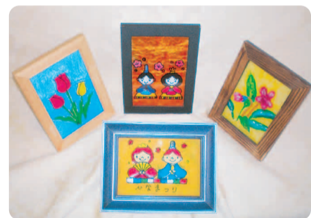
ガラスペインティングの作品

☎ (485) 7821 FAX (485) 1854 URL http://kusabue.shteikanri-sakura.jp Email info@kusabue.shteikanri-sakura.jp