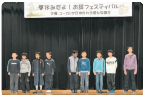
子どもたちに大人気のお話フェスティバル

3月25日(日) 志津コミュニティセンター大ホールで、ユーカリが丘地区社協主催のお話フェスティバルが一年ぶりに開催されました。