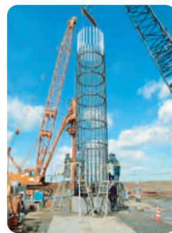
全長51mの杭に使われる鉄筋