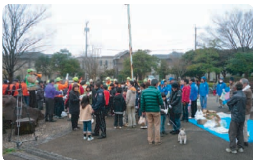
南公園に集合した各団体

3月18日(日)、ユーカリが丘地区社協主催の「クリーン大作戦」が、南公園や青菅小、志津小の各場所を中心に、地区社協、各小学校児童や井野中生徒、PTA、各防犯団体、子ども会、山万グループなどが参加し行われました。