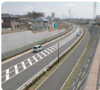
長割橋からスカイプラザ方面へ。広々とした歩道と電線が地中化された美しい景観

「未来の見える街」ユーカリが丘がさらに便利に 二本の都市計画道路が3月21日 堂々開通