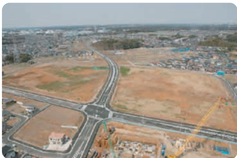
ウエストタワーからミライア街区を望む