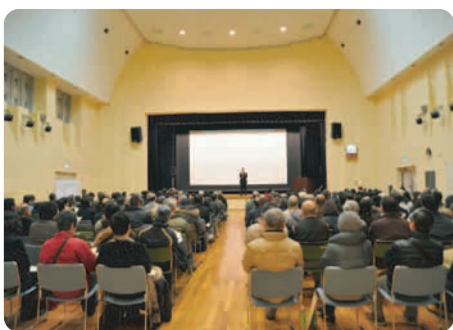
フォーラムの様子

特に高齢者は、佐倉市では昨年22.3%(千葉県平均は約20%)です。千葉県では50年後には4割が高齢者になる予測です。千葉県における刑法犯の件数は減少傾向ですが、高齢者が被害を受ける率は増えています。忍び込みや振り込め詐欺などが原因です。振り込め詐欺の被害の75%が高齢者です。手口が年々多様化巧妙化しています。実際の例を紹介すると、保険会社から証書が届いたかと息子を名乗り電話があり、その後仕事でミスをしてしまい、弁償をしなければならぬなどと言ってお金を用意させ、宅配業者を装った犯人に500万円もの大金を渡し、戻った事件があります。同じ様な手口が複数報告されているとのこと。携帯電話の番号