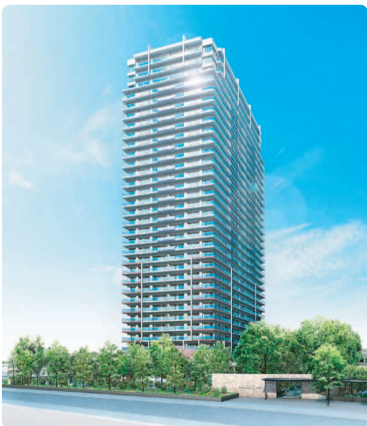
東南外観タワー ※完成予想図(イメージバースであり実際と異なる場合があります)

また、ユーカリが丘駅前既設の商業施設群と連携・分担し、地域の生活利便性と都市活力の向上に寄与します。