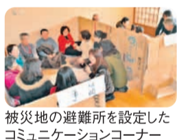
被災地の避難所を設定したコミュニケーションコーナー

2月11日(土・祝) 志津コミュニティセンターにおいて、V連と佐倉市社会福祉協議会共催で開催され、620名を越す参加者で終日賑わいました。会場ではボランティア団体や福祉施設の手作り品販売や、ユーカリが丘地区社会福祉協議会と志津地区社会福祉協議会の協力による高齢