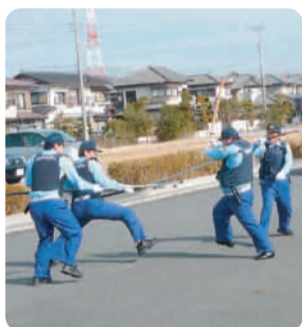
防護・制圧実戦訓練