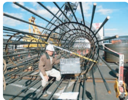
直径2mを超える基礎杭施工風景