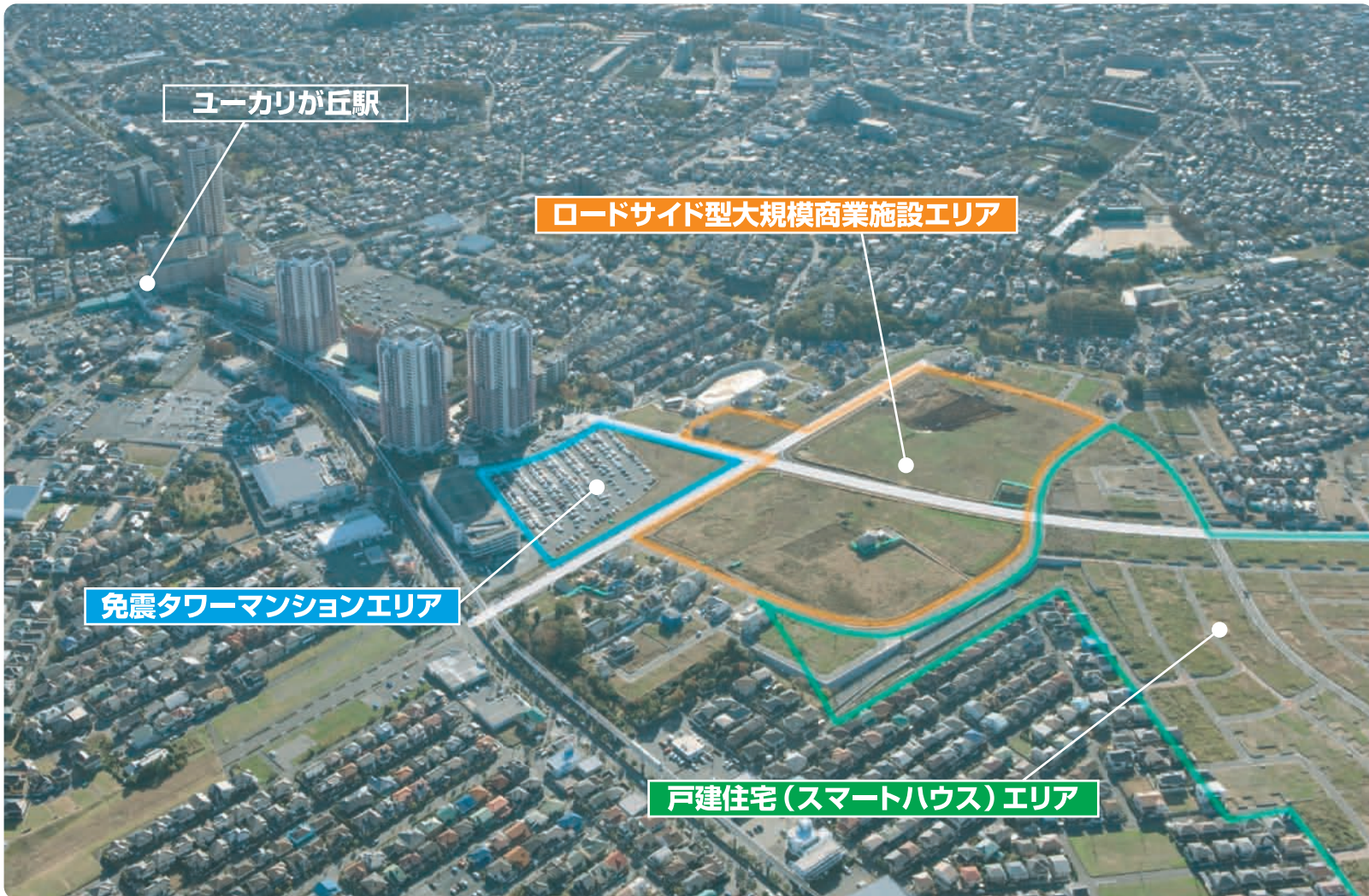
ミライア街区の航空写真(2011年11月) ※エリアは実際の計画で変更になる場合があります

「未来の見える街」ユーカリが丘がさらに便利に 二本の都市計画道路が3月21日 堂々開通