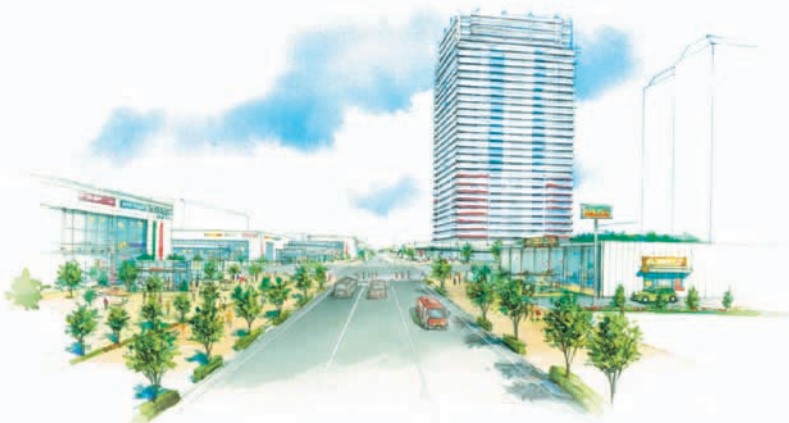
ロードサイド型大規模商業施設エリア ※完成予想図(イメージパースであり実際と異なる場合があります)