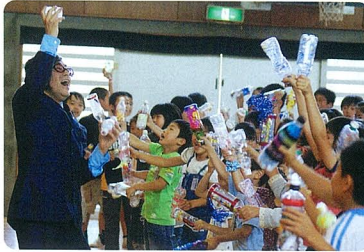
盛り上がる児童たち