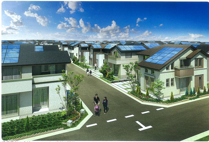
千葉県初の全棟スマートハウス分譲を開始

また、ユーカリが丘のシンボル「山万ユーカリが丘線こあら号」の普段入ることのできない運転席で運転手気分を味わったり、街を警備するかわいいパトカーと一緒に写真を撮ったりと、このエコツアーを楽しまれたようす。 大人は、手軽に乗れる電気自動車「三菱iMIEV」が