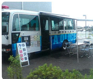
移動交番で気軽にご相談を