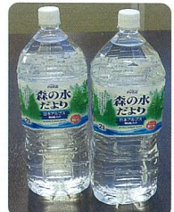
住民に配布される予定の飲料水 ワイ・エム・セキュリティ訓練の紹介