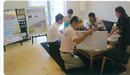
モデルハウスでエコタウンの説明