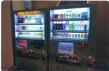
災害対応用自販機と寄付金機能付き自販機