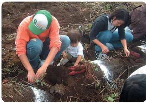
草ぶえの丘のさつまいも掘り