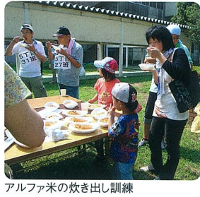
アルファ米の炊き出し訓練

最後に、今日の訓練をきっかけに家族の安全確認の方法を決めておくことなどが主催者側から話があり、訓練を終りました。