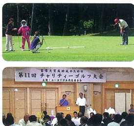
プレー中(上)／大会表彰式(下)