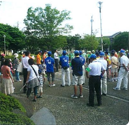
地域の防犯団体やPTAが集結

トロールしましょう、とお話があり、四つの班に分かれてパトロールを行いました。盗難の多い駐輪場や子どもたちの遊ぶ公園などを重点的に回り、街の安全を確認し合いました。