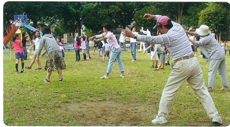
復活したラジオ体操 (西ヶ作公園)

災害から考える地域活動 3月の東日本大震災だけではなく、毎年のように災害に見舞われている日本。「災害にも強い地域づくりを」という目標として、研修会が、佐倉市社会福祉センターにて開催されました。7月18日(月)祝日も関わらず、佐倉市内の14地区社会福祉協議会とボランティアセンター「サポーターセンター」登録の100名を超える方々が参加しました。