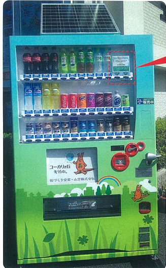
最新自販機(ソーラー付き)