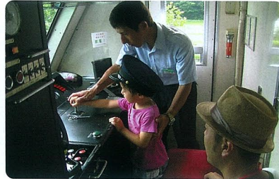
気分はこあら号の運転手