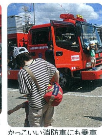
かっこいい消防車にも乗車

●ユーカリ商連主催 第11回 盲導犬育成のためのチャリ ティゴルフ大会 盛大に開催 「初めて実際に盲導犬を希 望者の手に」 今年で11回目を迎える盲導 犬育成チャリティゴルフ大会が、 八千代カントリークラブで開催さ れ、147人の参加がありました。 前回10回記念大会ではでき れば実際に盲導犬を寄贈する場 を大会会場で設けたいというこ とで、いろいろ各方面に「尽力 」に条件の合う方が見つからず、 断念しました。今年こそはとい うことで、日本盲導犬協会のご 協力で、なんとか実際に盲導犬 を希望者に寄贈することができ ました。大会当日のパーティー会 場には、寄贈される方もお見え になり、盲導犬の必要性和感謝 のお言葉を皆さんにお話した いただきました。参加者同感激し 、今後のさらなる支援を誓いま した。