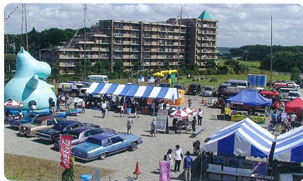
わくわくオータムフェスタ会場 移動動物園も