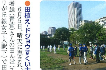
駐輪場や公園などを重点的にパトロール