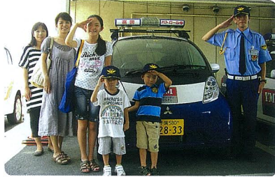
電気自動車のパトロールカー前で

試乗出来たり、自然豊かなユーカリが丘で家族写真を撮ったりとそれぞれ楽しめたようです。あなたも「ユーカリが丘」の街を散策してみたいかがですか？