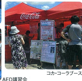
ココ・コーラブース