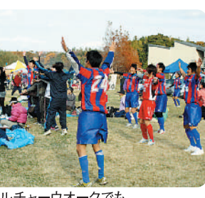
カルチャーウォークでもユーカリダンスを披露

歴史や自然を堪能し、楽しげに語りながらのウォーキング。それぞれのスタイルでゴールの女子大学セミナーハウスをめぐり、歴史や自然を堪能し、楽しげに語りながらのウォーキング。それぞれのスタイルでゴールの女子大学セミナーハウスをめぐり、歴史や自然を堪能し、楽しげに語りながらのウォーキング。それぞれのスタイルでゴールの女子大学セミナーハウスをめぐり、歴史や自然を堪能し、楽しげに語りながらのウォーキング。