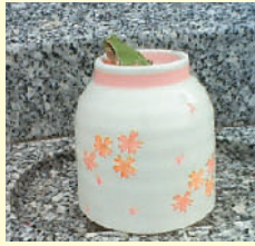
撮影:金田 太さん (宮ノ台) H21年10月