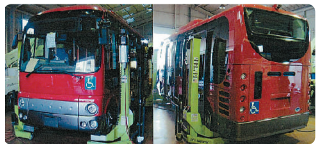
昨年の社会実験を経て、実用化に向けて開発が進む 新型電気バス「WEB-3」

とのこと。ユーカリの森と工 房をわがまちの皆さんのコ ミュニケーション醸成の場と して、ユーカリが丘オリジナ ルな活動の場として育ててい きたいという自然と体に優 しいプロジェクト。こちらも 詳細が決まり次第発表され るようですが、身近な話題 として大いに期待されるこ ころではないでしょうか? 更に、一昨年の本誌4月号 (37号)でご紹介した、街の 巨大ジオラマが話題になった 『ユーカリが丘街ギャラリー』 のリニューアルが計画されて います。街ギャラリーの一部 を改装し、「カンファレンスコ ーナー」や「アートギャラー コーナー」を設ける等、今ま で以上にわがまちの情報を 発信できる仕掛けと、より 住民の方々に気軽にご利用 して頂けるスペースを併せ持 った空間として、今年の2月 を目途にリニューアルオー プンされる予定。こちらも非 常に楽しみ、是非とも足を 運んで、もつとわがまちを知 りたいと思います。 その他にも、住み替え安 心システムとして知られてい る『ユーカリが丘ハッピーサ ークルシステム』を発展させ、よ り生活に密着したサービス の提供も考案中であり、今 年から具体的な検討に着手 しているとのこと。ユーカリ が丘ならではの地域密着型 サービスが提供されるとよ り「層」が充実し、わがまちが 一段とパワーアップすること 間違いなしです。今年も楽し みな話題が盛りだくさんの ユーカリが丘に二層注目が集 まりそうです。