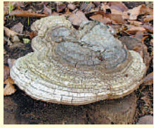
(宮ノ台) H21年12月

南門原公園(宮ノ台)で見かけた直径26cmほどのキノコ。ついで、腰掛けたくなりました。