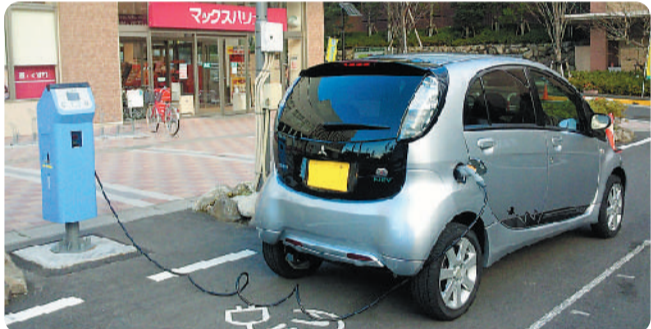
電気自動車によるカーシェアリングも開始されます (給電中の電気自動車)

4月から6月にかけて山万(株) ・早稲田大学・昭和飛行機工 業(株)と共同で行われた電気 バスの社会実験に引き続き、 山万(株)・日本ユニシス(株)と共 同で9月から実施中の給電 スタンドインフラの社会実験 等、低炭素交通によるCO 2 削減に向け、時代を先取り した取組みが行われました。 地球温暖化防止に向けた先 進的な取組みはマスコミにも 多く取り上げられる等、関 係各方面からも高い関心を 呼びました。また、昨年11月 末には佐倉カルチャーウオー クが初めてユーカリが丘を会 場にして2日間開催され、日 本全国から16000人を超 える多くの方がユーカリが 丘から佐倉市内一帯を散策 されました。大会メイン会 場となった和洋女子大学セミ ナーハウスグラウンドでは同日、エ コと健康をテーマにしたハッ ピネスライフフェアが同時開 催され、参加者の皆さんが