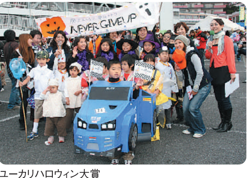
ユーカリハロウィン大賞

ひまわりエコプロジェクトは、財団法人千葉県環境財団環境再生基金チームが資源循環を体験できる取り組みとして毎年実施しているものです。イベント会場では、半年間に渡るプロジェクトのパネルや油を見ながら、資源循環についてたくさん関心が寄せられています。