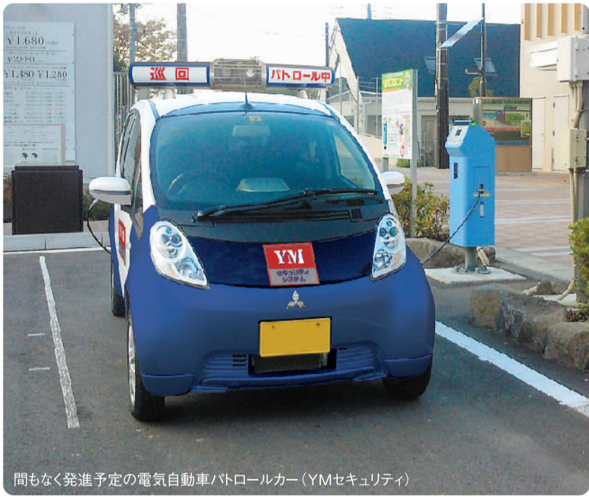
間もなく発進予定の電気自動車パトロールカー (YMセキュリティ)