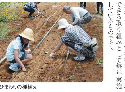
ひまわりの種植え

ひまわりエコプロジェクトは、財団法人千葉県環境財団環境再生基金チームが資源循環を体験できる取り組みとして毎年実施しているものです。イベント会場では、半年間に渡るプロジェクトのパネルや油を見ながら、資源循環についてたくさん関心が寄せられています。