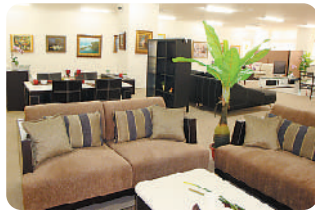
アートギャラリー・ユーカリ

地域の皆さんと一緒に街づくりをしていこうというコンセプトを注いできました。住民の皆さんが安全に安心して暮らせるような地域になるよう、様々な相談にも応じるために山方のエリアマネジメントグループのスタッフが、交代で勤務しています。また、ボランティア活動の打ち合わせやお買い物のおとのお休み処としてもどうぞ遠慮なくご利用ください。スタッフがおいしいコーヒーを無料でお出しします。静物画や風景画を中心に、抽象画など全部で92点の絵画があります。全部を展示することは出来ないのですが、架け替えがありますが、詳しくお知りになりたい方はリストがありますので、スタッフに声をかけてくださればご説明いたします