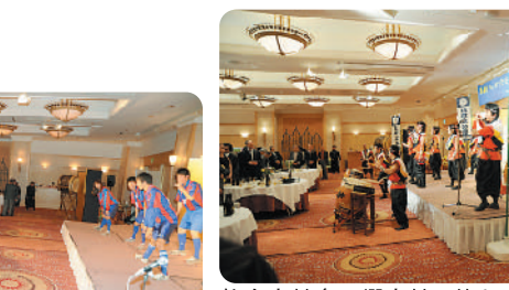
佐倉太鼓楽 櫻太鼓の皆さん

併設したグループホームも様々な施策に取り組んでいる状況をお話しいただきました。会場には、地元の方を中心に両部の部も200名前後の方が参加され、関心の高さがうかがえました。中には積極的に関与する方もいて、講師の方々も大変喜んでお答えしていました。