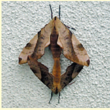
撮影:大津 惇さん (宮ノ台) H21年8月

【愛ほ形(ハート)だけでない】 宮ノ台V邸の門壁で見かけました。 家紋と見間違えそう。