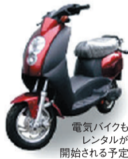
電気バイクも レンタルが 開始される予定

実現に向けた取組みの詳細 は順次発表されるとのこと であり、非常に楽しみで発 表が待ち遠しいところです。 また、ユーカリが丘ならで はのエコ環境づくり&地域 活性化の取組みとして『ユー カリの森』を構想中とのこと。 ユーカリの木は、非常に成長 が早く、葉からとれる精油 は殺菌作用や鎮痛・鎮静作 用が高いことで知られ、花粉 症にも効果があるとのこと。 このような効能があるユー カリの木を苗木から育てて、 森を形成しようというプロ ジェクト。ユーカリの森には工 房を併設して、ユーカリオイ ルやユーカリアロマ(香水)、ユ ーカリ茶、ユーカリの工芸品 や苗木の販売等、地域特産 品としてのユーカリが丘ブラ ンド商品の開発も進めたい