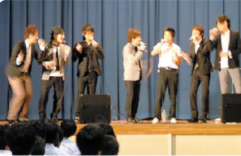
アカベラグループ「インスピ」の皆さんと

歌いたい楽譜各自持参。営業時間 18時～23時(定休日 火曜日)。お問い合わせ (462) 1176。