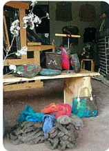
フェルトを作って、製作した作品のバッグ。写真下はフェルトを作る時の原毛です。