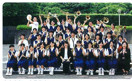
吹奏楽部 全員集合

井野中学校吹奏楽部が、緑まつり、三世交代交流会、ユカリフェスタなどの地域の行事で長年にわたり演奏してきたことに、教育委員会から表彰されました。