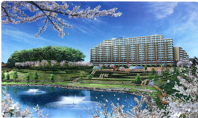
太陽光発電や風力発電を採用した宮の杜公園 ※実際とは異なる場合があります。

新緑の爽やかな風の中、中学校駅前「ピオトピア」エリアを「エココロ」探しに「ちい散歩」を試してみたいかがでしょうか。