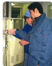
券売機の裏はこうなってるんだ

これらの学習をおして児童は、次のような感想を述べ、たくさんの方を学び感じることができたようです。