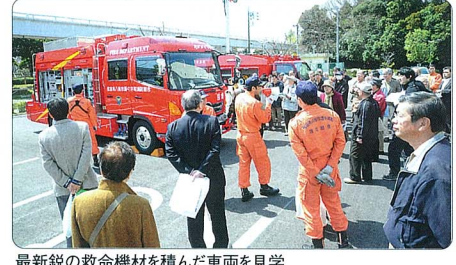
最新鋭の救命機材を積んだ車両を見学