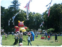
昨年の様子。こいのぼりがいっぱい