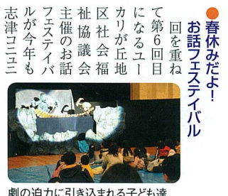
劇の迫りに引き込まれる子ども達

●クリーン大作戦 3月22日(土)ユーカリが丘地区社協ボランティア事業部主催「ユーカリが丘クリーン大作戦」が開催されました。各自治会、自主防犯グループ、青中小、井野小、小竹小、井野中の小中学生と保護者、クライネスサービス、山方グループから、総勢200名の参加者が、南公園を起点とし、青菅小方面・井野小方面、小竹小方面、ユーカリが丘駅方面に分かれてゴミ拾いをし、ユーカリが丘調整池前花壇にはビオラ500株を植えました。開始前には、ユーカリが丘地区社協坪松会長から、清掃活動が長年にわたって継続的に行われてきた結果、ゴミの分別について、佐倉市役所廃棄物対策課の方から説明を受けました。参加した小学生からは、タバコの吸殻が多い事に驚きましたが、小さなゴミを二つ拾うことで、自分たちは二度とゴミ捨てをしなさいと決めましたと感想をもちました。花植えをした中学生は、自分で植えた花が、ユーカリが丘のまちを明るく出来て嬉しかったので、また次回も参加したいとさわやかな笑顔で帰って行きました。