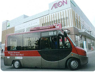
中学校駅東側ロータリーを出発