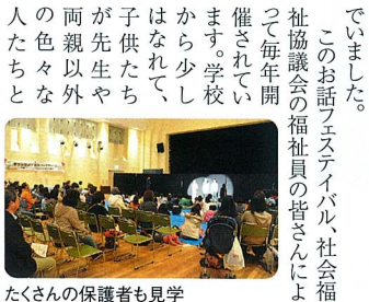
さあ、ゴミ拾いに出発

●クリーン大作戦 3月22日(土)ユーカリが丘地区社協ボランティア事業部主催「ユーカリが丘クリーン大作戦」が開催されました。各自治会、自主防犯グループ、青中小、井野小、小竹小、井野中の小中学生と保護者、クライネスサービス、山方グループから、総勢200名の参加者が、南公園を起点とし、青菅小方面・井野小方面、小竹小方面、ユーカリが丘駅方面に分かれてゴミ拾いをし、ユーカリが丘調整池前花壇にはビオラ500株を植えました。開始前には、ユーカリが丘地区社協坪松会長から、清掃活動が長年にわたって継続的に行われてきた結果、ゴミの分別について、佐倉市役所廃棄物対策課の方から説明を受けました。参加した小学生からは、タバコの吸殻が多い事に驚きましたが、小さなゴミを二つ拾うことで、自分たちは二度とゴミ捨てをしなさいと決めましたと感想をもちました。花植えをした中学生は、自分で植えた花が、ユーカリが丘のまちを明るく出来て嬉しかったので、また次回も参加したいとさわやかな笑顔で帰って行きました。