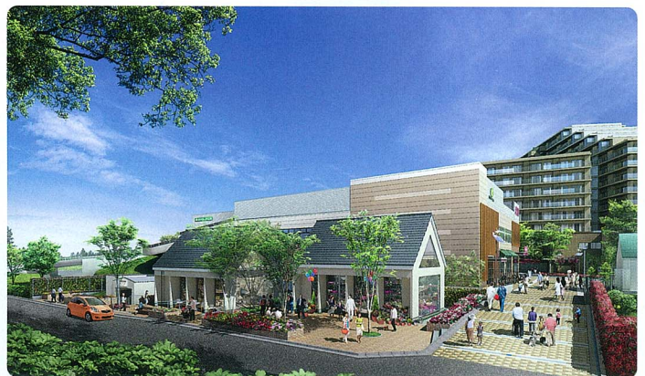
中学校駅前店舗からマンションまでの舗道には、太陽光によって夜間足元が光る「ソーラーブリック」も ※実際とは異なる場合があります。