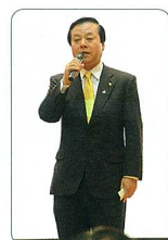
藤和雄市長のご挨拶