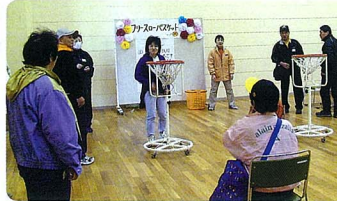
座りながらのフリースローバスケット

●障がい者団体連絡会主催 事業の開催 みなでチャレンジ!! 佐倉市の総合福祉研修の一環で、障がい者団体連絡会が中心となつて実行委員会を立ち上げ、研修を受けたスタッフやボランティアで3月15日(日)に志津コミュニティセンターにて、「みなでチャレンジ!!」が開催されました。パラボール、ボーリング、フリースローバスケット、宝探し&パン食いの人までみん