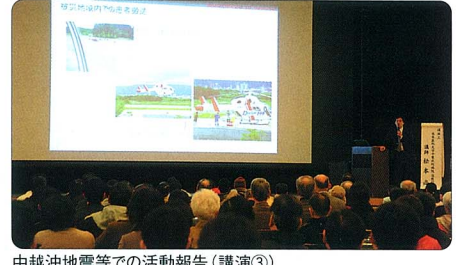
中越沖地震等での活動報告(講演③)