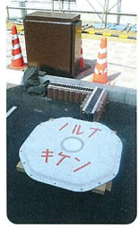
日本初、非接触型充電器