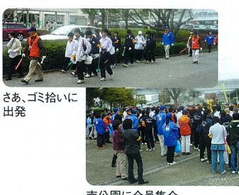
南公園に全員集合