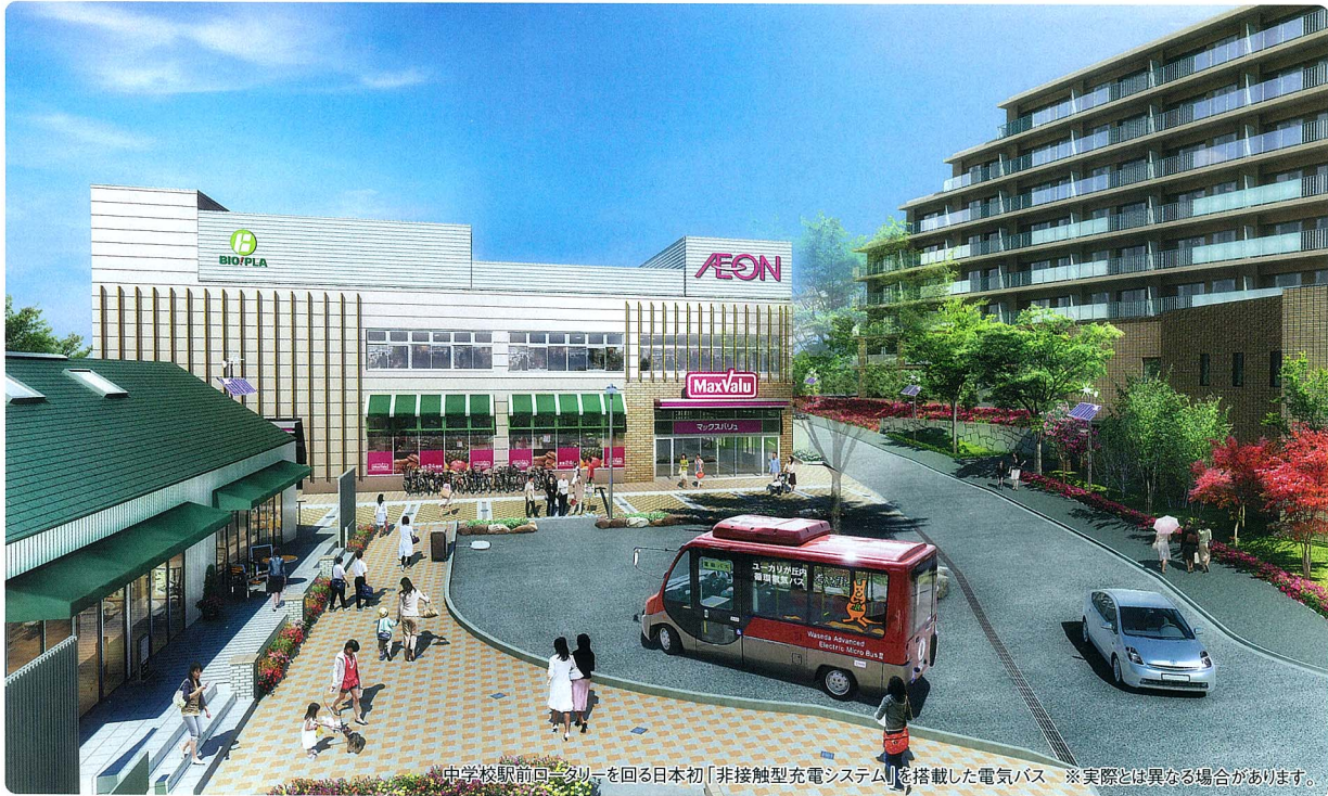
中学校駅前ロータリーを回る日本初「非接触型充電システム」を搭載した電気バス ※実際とは異なる場合があります。

編集・発行 わがまち編集委員会 〒285-0859 佐倉市南ユーカリが丘1番地1 TEL.043-487-8111(代) FAX.043-487-8116 発行月/1・4・9月(担当/清水)