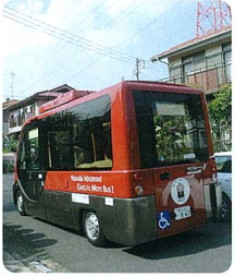
住宅地内はゆっくり走行