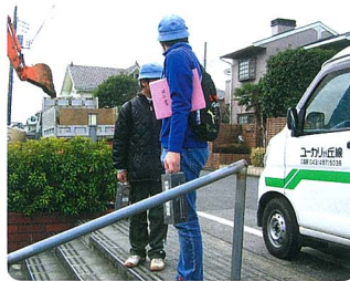
山万ユカリが丘線の各駅を巡回

事前準備として、9月の受け入れ先の選定・協力依頼。11月に入り、受け入れ先決定。1月には、受け入れ先の企業との打合せ。道徳の「勤労・奉仕」の授業の実施。そして、2月5日(木)に実際に職場体験を実施しました。事後指導では、各事業所へのお礼の手紙作成とお互いの職場体験の報告会を行いました。