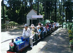
ミニ鉄道も運行中

URL http://kusabue.shiteikanri-sakurai.jp