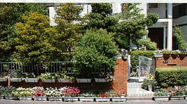
ユーカリ二丁目野田さん宅の玄関

「ユーカリが丘」の出会い。私は一〇〇%満足したわけではなかったが、営業所に帰ると、妻の積極的な発言が続き、手付けも用意していたのには驚いた。