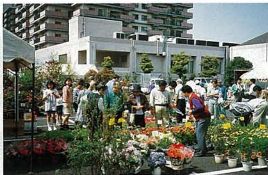
緑のまつりのにぎわい