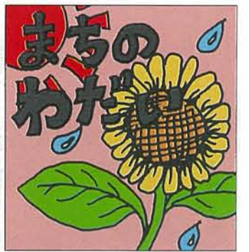
カット 森本 西(13才)