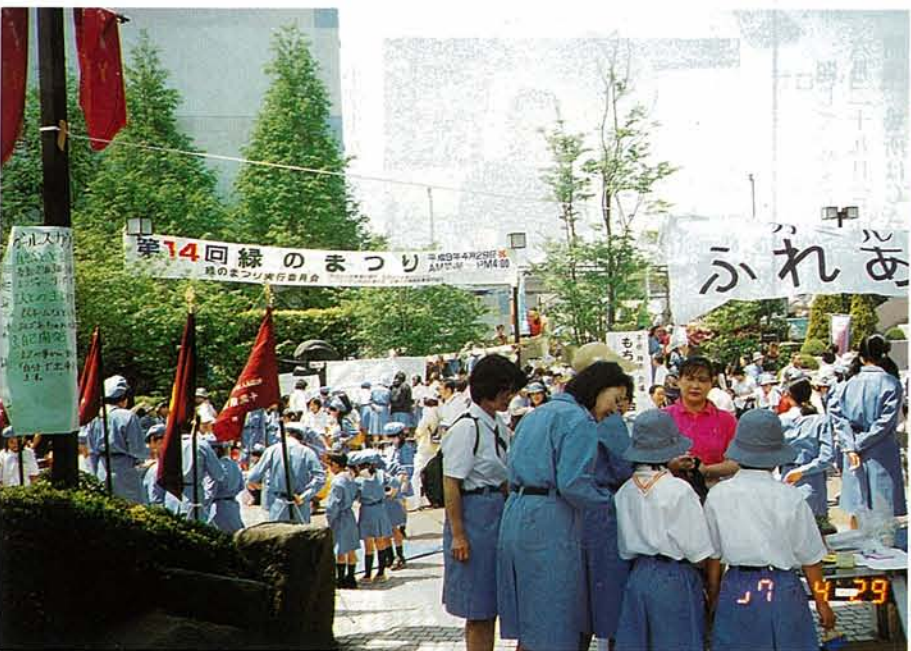
「緑のまつり」にぎわしく

4月29日はさつき晴れ。サティとその周辺の「緑のまつり」コミセンの「社協バザー」は大にぎわい