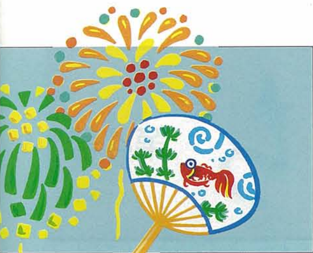
企画・構成/寺田・森本