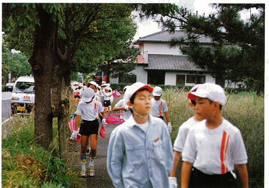
小竹小 児童が街清掃

4月29日はさつき晴れ。サティとその周辺の「緑のまつり」コミセンの「社協バザー」は大にぎわい