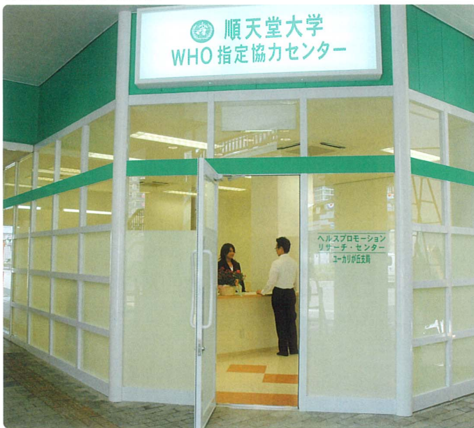
さわやかな白と緑で統一された外観