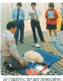
AED講習会に取り組む組員真剣な眼差し

た医療機器で、傷病者の心電図を自動解析し、「除細動」が必要な場合を判断して、必要なときにだけ救護者に音声による指示を出す仕組みになっています。昨年七月の救急処置基準の改正で、一般人の使用が可能となったのも、佐倉市八街市酒々井町消防組合管内では、民間事業所でも初めての設置で、千葉県内でも成田空港関係を除いてはほとんど例がないとのこと。パトロールセンターに勤務するワイエムメンションホタル、ユーカーリなど、特にそういつた機会に遭遇する可能性がある人を中心に、佐倉市八街市酒々井町消防組合消防本部の講習会を受講し、万の時に備えています。