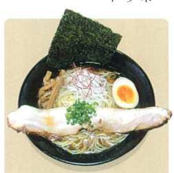
本格派しょうゆラーメンの「ユーカーラーめん」750円

店名ともなっている蔵六餅は佐倉藩主堀田家に伝わる亀の形の奇石をモチーフに佐倉市が六ヶ町村、合併して市となったことを記念して亀のように永く発展するようにと願いを込めて作られたお菓子です。 今の時期の季節限定商品としては印旛沼の屋形船をモチーフとした「屋形船(くず)粉とわらび粉で作った餡豆腐、柚子、桜、抹茶、梅、こしあん、五つの味が楽しめます。 ユーカーリが丘地区の蔵六餅の販売はサテ *お問い合わせ ユーカーリ軒 ☎462-16695 *営業時間 土時～二十二時 *定休日 木曜日