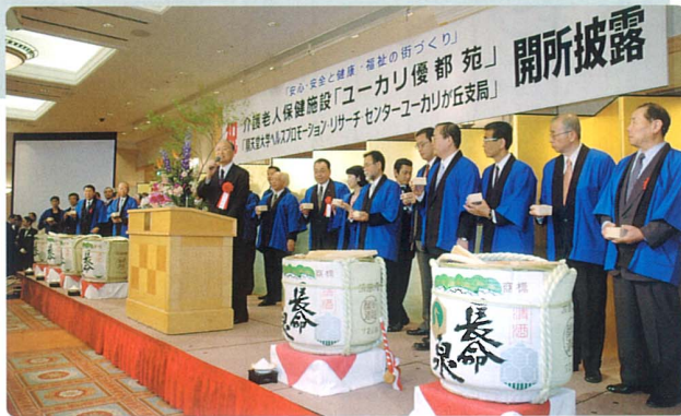
鏡割りに参加されたご来賓の方々

ユーカリ優都苑は、山万株式会社が進進している「ユーカリが丘福祉の街構想」の環としてユーカリが丘に隣接する青菅の総合福祉エリア内に整備されました。また、わがまち第一十八号にて紹介いたしました、同社の「ユーカリが丘ハッピーサークルシステム」の翼を担う施設でもあり、このシステムは、お子さんのいらっしゃるご家庭からお年寄りのご夫婦まで、健康な方から要介護認定を受けている方まで、年齢や心身の状況、一緒に住ま