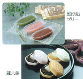
屋形船(くず)粉 蔵六餅

イ店内「小川園」にて取り扱います。本店 蔵の見学は茶菓子付き五百円、毎月十日には茶道体験もできますので、お気軽にお立ち寄り下さい。 *お問い合わせ (株)木村屋 ☎484-10022(本店)