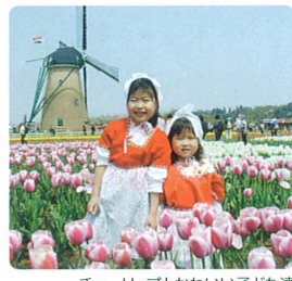
チューリップとかわいい子ども達

今年で十七回を迎える佐倉チューリップまつりが、四月十三日、十七日まで印旛沼のほとり竜神橋そばの佐倉さとの広場で行われました。例年は十二種十二万本のチューリップでしたが、今年から植栽範囲を拡大し、三十五倍の三十四種四十二万本が咲き競いました。 佐倉は江戸時代より「西の長崎、東の佐倉」といわれるほど蘭学が盛んな土地で、オランダとまつ結びつきが強く、チューリップまつりやオランダ風車リーフェ(友愛)が誕生したのでしょう。 佐倉市観光協会の話では将来百万本のまつりを目指しているとのこと。来年は是非チューリップまつりを一瞥にしませんか? お問い合わせ 佐倉市観光協会 ☎486-16000