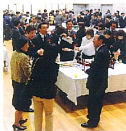
NPO法人化をたくさんの方が祝福

として、自治会協議会、地元小学校のPTA会長、佐倉防犯パトロールネットワークの方々など、たくさんの来賓が参加され、祝辞が述べられました。 これを契機にします「クライネスサービス」が地域の防犯・環境整備・美化等の活動の中心となつて、よりよい街づくりのために活動されることを期待しています。