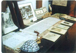
蔵六餅本舗木村屋本店の蔵に飾られた由緒正しき品々!

木村屋は、銀座木村屋の二号店として、佐倉の歩兵連隊に非常食やパンを納入する御用商人として、明治十五年に佐倉の地で創業しました。 本店には、前の持ち主である油屋が建てた蔵があり、それを初代が買い取り戦火にもあわず使われていました。内部には安政五年のものなど歴史を垣間見る助として公開されています。 ユーカーリが丘地区の蔵六餅の販売はサテ