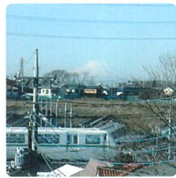
こあら号のかなたに富士山が!

三月二日(水)井野小学校東側の隣接地にある「井野長割遺跡」が国の史跡として指定されました。縄文時代中期～晩期にかけて集落跡であり、特徴としては、推定で南北六〇m、東西二〇mの楕円形に配置された「環状盛土遺構」と土砂の堆積があげられます。道路跡なども発見され、また「異形台付土器」など、縄文時代の人々の営みを知ることができます。貴重な資料も見つかっています。 詳しくは 佐倉市文化課 ☎484-16192