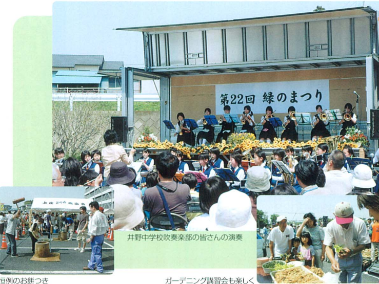
井野中学校吹奏楽部の皆さんの演奏