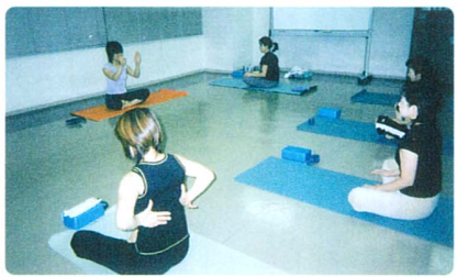
手軽にできるヨーガ