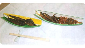
●その他名産品情報がございます。もしよろしければお寄せください。

●ユーカー小町とユーカーが丘娘 チーズむしケーキにいちごジャム(ユーカー小町)か、ブルーベリージャム(ユーカーが丘娘)と生クリームで仕上げた新食感のおもちです。ユーカーが丘サテイ階のペーカリーで販売)