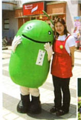
環境省のエコキャラクター「コマメちゃん」