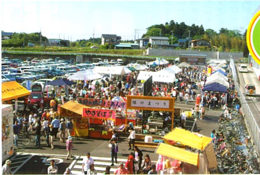
第21回「緑のまつり」メイン会場