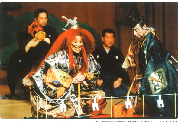
国立能楽堂定例公演「小鍛冶」一月十六日

その文章を、お礼の手紙に写して「演能もまた「思想」になり得ますね、と書き送った。平成十四年七月のことである。「復啓 露草の拝めるごとき書