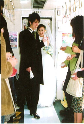
ラブリートレイン