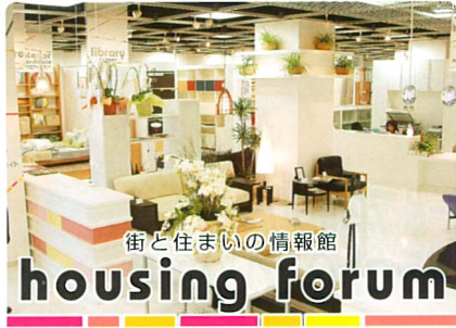
街と住まいの情報館