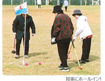
見事にホールイン!