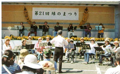
佐倉シヤルマンウインドオーケストラ