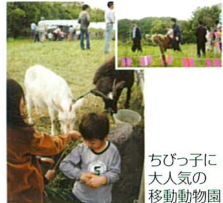
ちびっ子に大人気の移動動物園