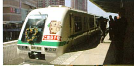
「猫のジョイ」パフォーマンス