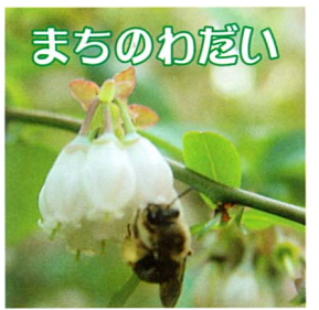
ブルーベリーの花と蜂