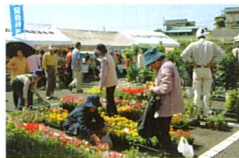
色とりどりの花も販売