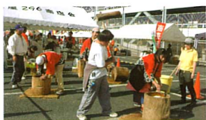
もちつきも大好評