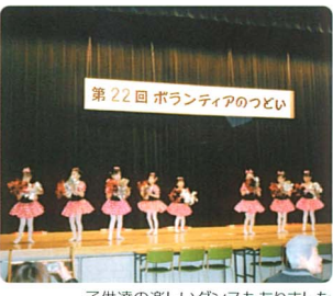
子供達の楽しいダンスもありました

佐倉市ボランテア連絡協議会主催の「第二十二回ボランテアのつどい」が、平成十六年二月十一日、志津コミュニティセンターにて行われました。当日の朝は、小雪が舞うあいにくの天気でしたが、次第に晴れて気温も上がり、約五百名の参加がありました。午前中は、手話ダンスやマジック、アコーディオン演奏などのボランテアグループの活動発表があり、昼には、実行委員による手作りのカレーやおにぎりなどが振舞われました。午後からは、志津ジュニアリーダーズの指導で参加者全員でゲームを楽しんだ後、「環境支援」など七つの分科会にわかれて交流会が開かれました。交流会では、コーディネーターを中心に日ごろボランテアをしていて思っていることをそれぞれが本音で語りあいました。その他にも模擬店や、グループ紹介の展示コーナー、社会福祉協議会のボランテア相談コーナーなどがあり、参加者が交流を深めた日となりました。