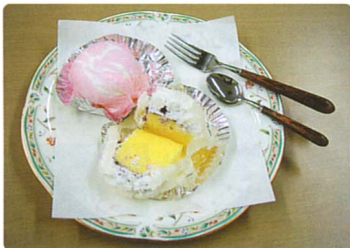
ユーカー小町(ピンク)とユーカーが丘娘(白)

●ユーカーが丘周辺名産ご紹介 今回のいちおし料理は佐倉名産の大和芋を使った料理です。佐倉の大和芋は築地の市場でも大変珍重されている高級品です。一般に「やまいも」や「ながいも」と同じ種類ですが、この大和芋は、手のひらの様な形が特徴です。他にもきつとたくさん料理があると思いますので、一度お店で探してみたいかががでしょうか。 また、大和芋以外にもユーカーが丘周辺には名産品がたくさんあります。今回はそのほんの一部をご紹介します。