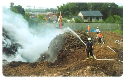
坂戸の大火災を消火

公園には、花火セットが捨てられていました。手に持ちきれないほどあつたけどほとんど取りました。ぼくは、こういうことをやるのが初めてだったけど楽しくできました。安全なからなかなのかもしれないと達がいいるからなのかもしれないと思いました。ぼくもまた中学生になつていそがしくなるけども時間があつたらやりたいなあと思いいい経験になりました。