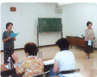
朗読会の練習風景

目の不自由な方へ朗読ボランティアとして昭和四十八年に会員六名にて発足。「広報さくら」「県民だより」「市議会だより」「社協さくら」「選挙公報」おろぎの会「おろぎの会」の月刊「おろぎ」また、「佐倉市生涯学習ハンドブック」「佐倉市発行の冊子をテープに録音、ダビングして、郵送ケースに入れ、視覚障害者にお届けしています。高齢者への対応として、いきいきサロンなどの朗読サービ