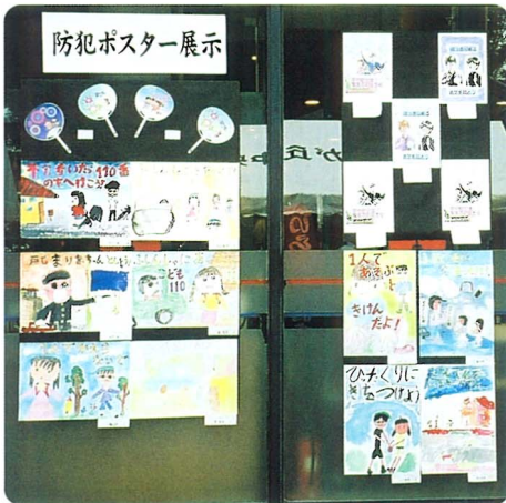
地元小中学生の防犯ポスター展 開催

また、各種の防犯グッズや防犯システムの展示、県警の「まちかど号」では防犯関係のバネルや情報が展示されましたが、犯罪が多発しているだけに熱心に見学されていました。