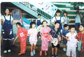
8月23日(土)に開催されたハローキッズ夏祭り

高齢化対策と同時に大切なが少子化対策です。働く女性を支援する為、ユウカリが丘駅隣接に平成十一年に誕生した駅前保育施設「ハローキッズ」は、日本初の園庭付き駅前託児所として注