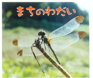
撮影 本田基命/宮ノ台4丁目