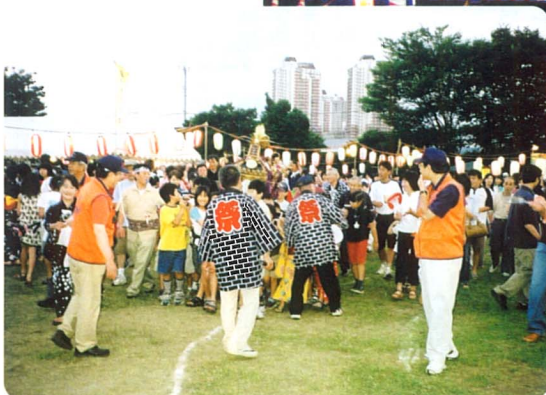
上座熊野神社の神輿も初参加。クライネスサービスが安全確保に活躍