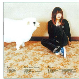
上座「宝樹院」 上座「熊野神社」

先ず「Resurango」、ピアノソナ「リベラタンゴ」に対抗?リズムを心地良くチェロとピアノのコラボレーションが元気にしてくれま