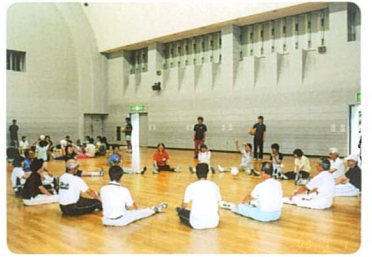
楽しくストレッチ

七月の第二火曜日、志津コミュニティセンターで行われている「ステイヤング」を取材しました。わがまち「工」号で「紹介したとおり、健康の維持と若さを保つこと」を目的にはじめられたサークルです。当初、中高年のためというお話なので、二年配の方が多いかと思っておりましたが、三十年代四十代と思われる方もいらつやるよう