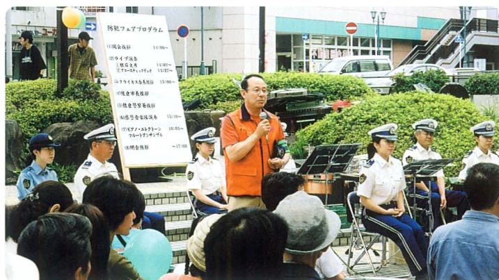
クライネスサービス評松会長のごあいさつ