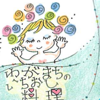
わがまちのいちお料理