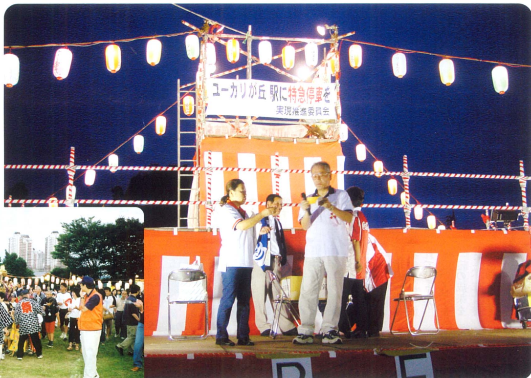
ユーカリまつり恒例のお楽しみ抽選会 豪華景品が続出!!

第21回を迎え、佐倉市最大級の夏祭りに成長した「ユーカリまつり」。今年も自治会・商店会が一体となり、7月26日(土)27日(日)の2日間盛大に開催されました。