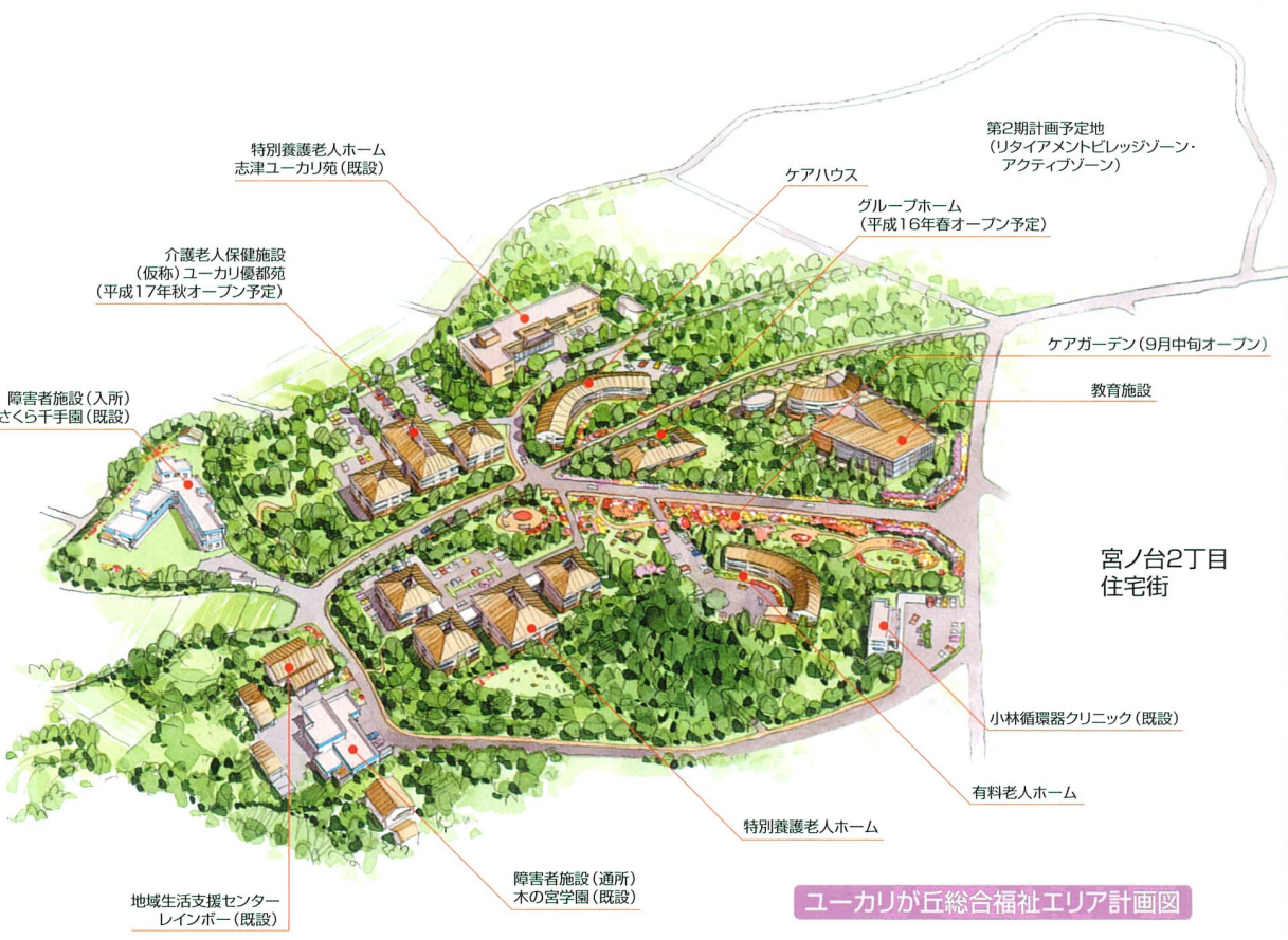
ユーカリが丘総合福祉エリア計画図