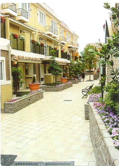
南ユーカリが丘「コラボハウス」のパティオ(中庭)

また、住戸は二層三層のメソネットタイプが中心。もちろん通常のフラットタイプもあります。全七十六戸の住民がゆったりとした空間の中庭を介して共存共生できる住まい「コラボハウス」早速には、映画の撮影に使われるとのこと。まさに「見る価値あり」です。