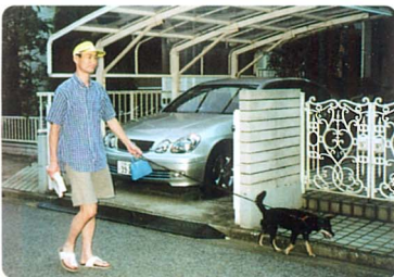
犬の散歩とパトロールの一石二鳥?

ニータウンではこのような組織は無いので、先に書きましたように五消防団でわがまちの災害時対応に大きな負担を頂いており、安全で安心して暮らせるのもこのような人達の陰の力によって支えられている事がよく分かりました。 お問合せ 462-0420 安藤迄