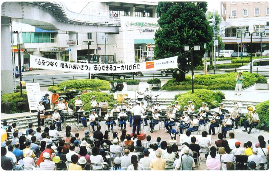
千葉県警音楽隊の演奏

防犯関係のバネルや情報が展示されましたが、犯罪が多発しているだけに熱心に見学されていました。