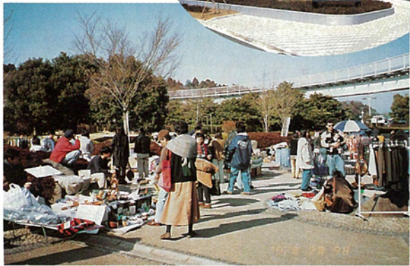
フリーマーケット (ユーカリが丘南公園)