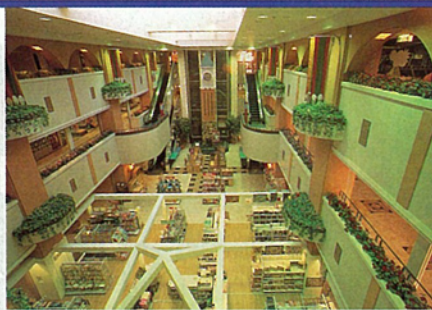
ユウカリが丘・サティ

ユウカリが丘は子供達や、青年、女性、熟年者、高齢者などすべての人々がいきいきと快適に暮らせる街でありたいと思います。子供達の為には学校、塾、医療施設だけでなく、遊園地やキッズワールド等子供の夢を育む施設を考へてあげたい。託児所、保育園、ベ