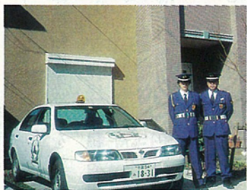
ワイ・エムセキュリティパトロール隊

ビーシッターなど充実し、子供の養育だけでなく、女性が安心して自由に働ける環境づくりを進めたい。職場の提供も高齢者のためには、NHK文化センター等の協力を得て各種催しや活動を積極的に行う一方、高齢者が無理なく働ける場所を提供し、生き甲斐のある生活を送れるように、特別養護老人ホームをはじめとするケア施設、ホームヘルパー、入浴給食サービス等を充実し、老後も安心して住めるような環境を創ってゆくことが重要です。またハンディを持つ方々には各種施設と連携してやさしい愛の手を差し伸べたい。このような点からもボランティア活動が活発化してほしいと願っています。住民が安心して住めるように、災害に強く犯罪のない街に