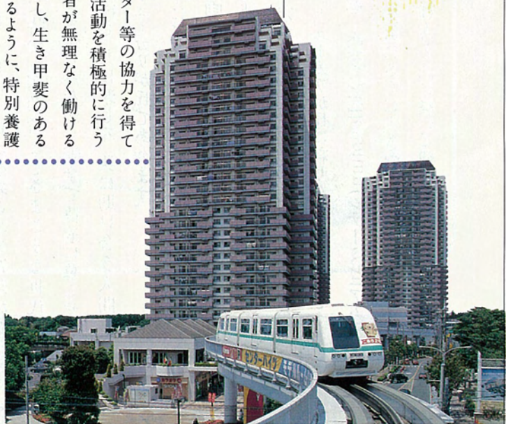
新交通システムユウカリが丘線