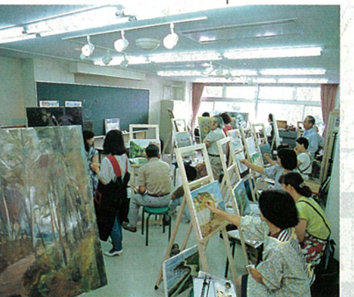
NHK文化センター(絵画教室)

ではありませんか。また、ユーカリが丘のアイデンティティを確立するとともに、住民ならではのサービスが受けられるよう、IDカードシステムを検討したいとも考えています。いつも時代を先取りする街でありたいものです。