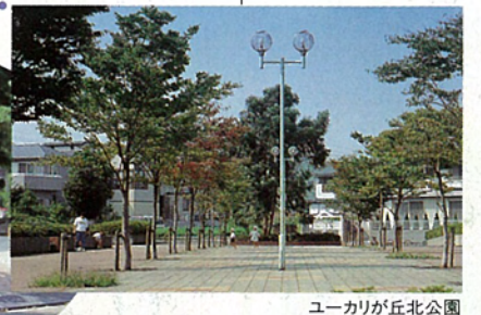
ユーカリが丘北公園