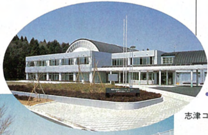
志津コミュニティセンター

定期的なタウン紙「わがまち」を発行し、住む方々同士が自由に意見をのべ、さまざまな情報を交換できる誌面になればと思います。また、ゴルフ・サッカー・野球・ゲートボール・釣りをはじめとする各種のスポーツ活動や、色々な趣味に集う多彩なクラブ活動が盛んに行われ、子供から成人・高齢者世代までがこぞって参加する。あらゆる機会に住む人同士の交流は行われ、すべての世代の人々が共に生活し、共に楽しみ、共に助け合う、人間性溢れる街でありたい。