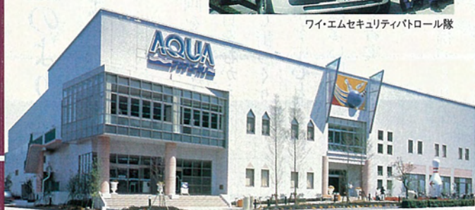
アクア・ユウカリ

することも大切です。街は、中期的には人口3万人、将来は周辺と融和を計りながら5〜10万人をめざしたい。縦横に巡らされた立体遊歩道を人々が行き交い、周辺の都市計画道路が完成され、車がスムーズに流れ、特急が停車、ユウカリが丘線が延伸され、周辺への行き来が便利になる。この様な街を夢見たいものです。