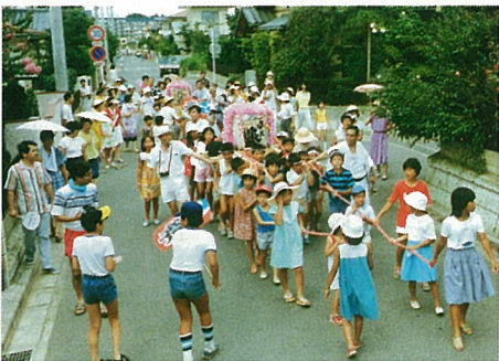
子供みこしが町内をねりあるきました

会場は、開校三年目の小竹小学校の校庭で、真夏の薄暮から開催された「第二回ユーカーまつり」は、今思うとどこかこころにある小じんまりとした「盆踊りを中心とした夏祭り」で、ユーカーが丘第一集会所第二集会所、五番町ハイツ集会所にいまも白黒写真で櫓の回りに集う人々が写されています。