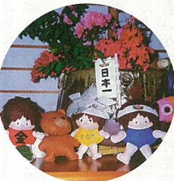
人形作家 大野保子作(宮ノ台3丁目)