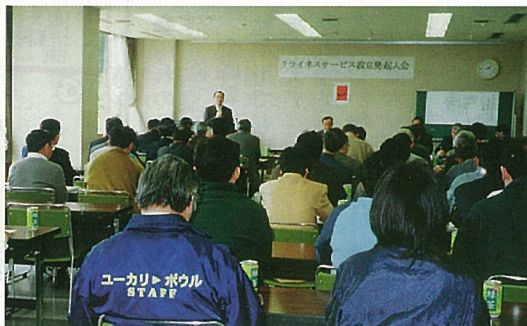
4月16日発起人会が盛大に開催されました