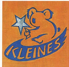
クライネスサービスのシンボルマーク

ここユーカリが丘を愛する有志は、将来にわたる住みよい街づくりの一翼を担い、犯罪・非行の抑止と共に青少年健全育成、防火・防災、交通事故防止、及び社会・公共の福祉に寄与することを目的として、「クライネスサービス(Kleines Service)」と名づけたボランティア組織を立ち上げることとしました。皆様にも是非参加していただきたく、一般会員・賛助会員・特別会員(企業・団体)の募集をしています。