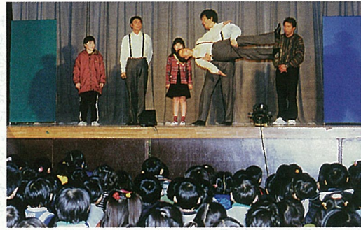
パントマイムの世界へようこそ

とにかく子供も大人もよく笑いました。パントマイムは現実に見えない物を表現豊かに目の前に次々と見せてくれます。見えないものを見ようとするおもしろさ、ちよつと違った視点を心の中に持ちながら、ひとりひとりの想像力をめいっぱいかきだてて…。