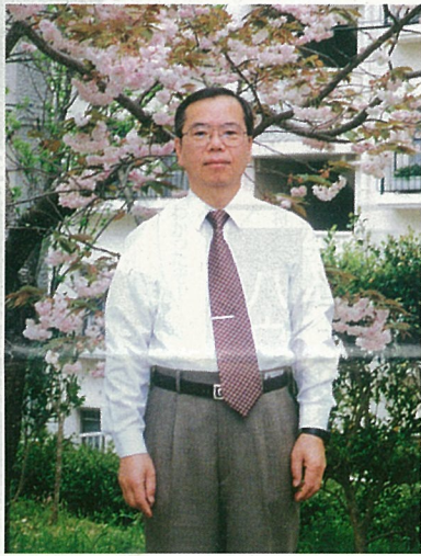
五番町ハイツの桜の前にて

う子供達が、新たに生活する街づくりをする時に、楽しい思い出と一緒に、豊かな自然と調和したユーカリの街が、目標となるような街づくりをしていかなければなりません。住み良い街、明るい街をつくるのは、私達この街の住民が主役にならなければ出来ません。私は、人と人とのつながりにおいて、『すみません』ではなく『ありがとう』で会話が締めくくられるユーカリが丘の街であればいいなと夢見ています。その夢の実現のためにがんばりますので、住民のみなさんご自身が主役ですので、快適な街づくりに参加していただければと思います。ご支援、ご協力を是非ともよろしくお願い致します。