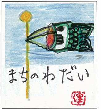
カット 大野 保子(宮ノ台三丁目)