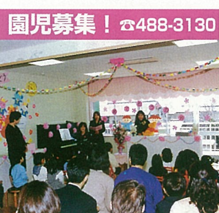
ハローキッズのはじめてのおめでとうの会(入卒園進級式)

★新緑の季節になり、街も新しい息吹に満ち溢れています。クライネスサービス等様々なボランティア活動も開始され、住民みずから街を住みよい素晴らしい街にしようという気運が高まっています。ひとりのちよつとした行動がやがて大きな力となって行くことでしょう。 ★今後のユーカー清掃は5/28、6/24、7/29、8/26の予定です。山万グループ社員がボランティアで行っています。街をきれいに皆の願いです。