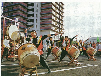
櫻太鼓の力強い演奏