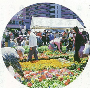
ガーデニング講習会なども行われた花の即売会

四月二十九日緑の日に第十七回緑のまつりが快晴の中、開催されました。千葉敬愛高校の吹奏楽部の演奏をはじめ、ハーレーのパレードや消防のはしご車体験など様々なイベントが行われました。