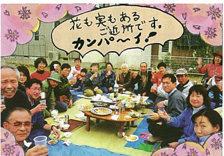
和気あいあいのお花見

井野中学校のグラウンド脇の桜の花を見ながら、花よりだんごとばかりに和気あいあいとお花見をする賑やかな住人達。この住人は、回覧板を廻す隣組、宮ノ台三・四・五丁目自治会第四班です。ご近所の方でもなかなか顔を合わせないご主人や子供達が年一回、この日は顔を合わせ情報交換をしています。この班は、宮ノ台に住んで十七年という古い方から最近引越して来たばかりという方が集まった班ですが、とても仲が良くまとまっています。