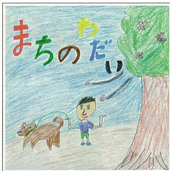
カット 小水 匠(小2・宮ノ台5丁目)